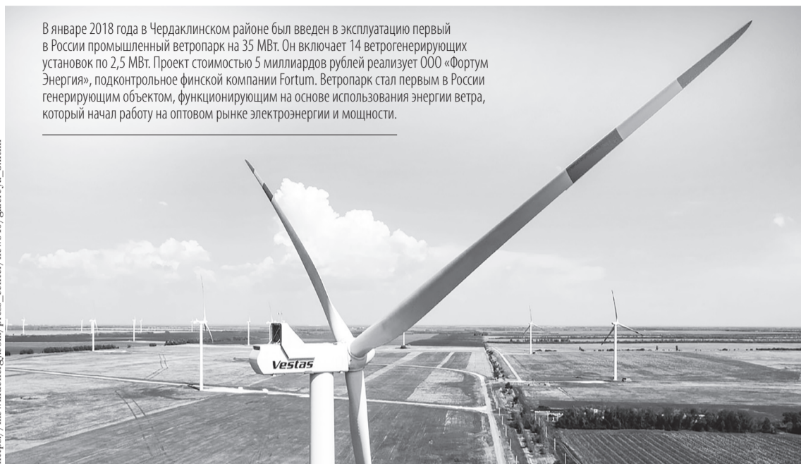
В январе 2018 года в Чердаклинском районе был введен в эксплуатацию первый в России промышленный ветропарк на 35 МВт. Он включает 14 ветрогенерирующих установок по 2,5 МВт. Проект стоимостью 5 миллиардов рублей реализует ООО «Фортум Энергия», подконтрольное финской компании Fortum. Ветропарк стал первым в России генерирующим объектом, функционирующим на основе использования энергии ветра, который начал работу на оптовом рынке электроэнергии и мощности.

Напомним: производство композитных лопастей в Ульяновске создано «Роснано» и областным консорциумом инвесторов, в состав которого входит ULNANOTECH, совместно с Vestas в 2018 году. Общие инвестиции составили более 2 млрд рублей. Согласно принятым обязательствам, стороны реализовали свои доли (по 24,5% у обеих сторон) мажоритарному участнику ООО «Вестас Мэньюфэкчуринг Рус», после чего стратегический партнер Vestas консолидировал 100% акций завода-производителя.